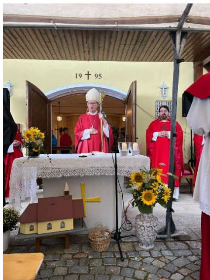
Jubiläum Kapelle Apfelbach